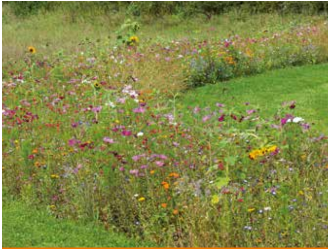
Luonnonvaraisia kukkapenkkejä pölyttäjille